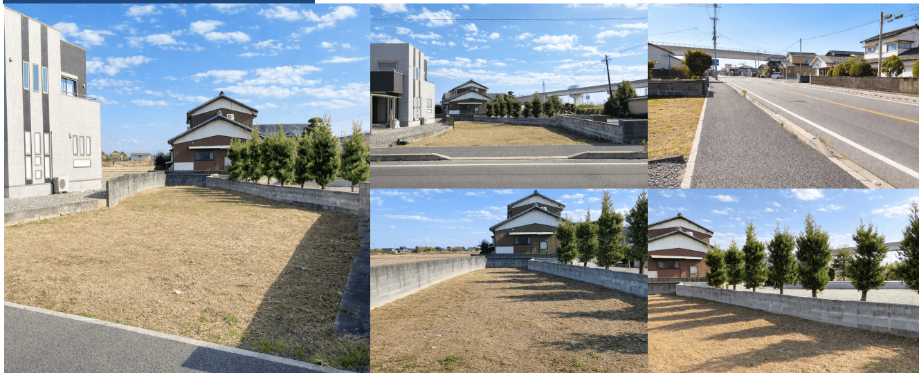
< 接道状況 >